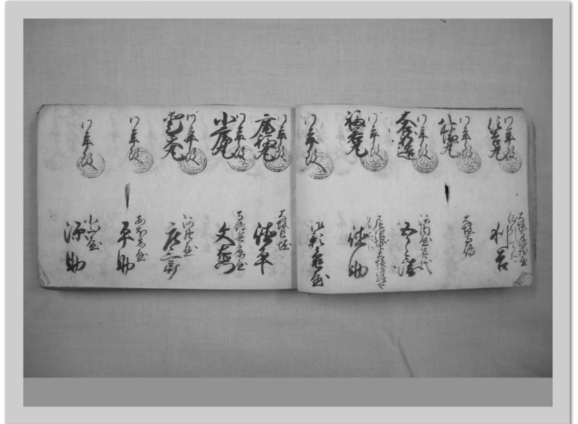
江戸時代に大坂・河内・尾張など広範囲の廻船が久津浦（現在は長門市）に入港していたことを伝えている （「奥藤博家文書」解題参照）