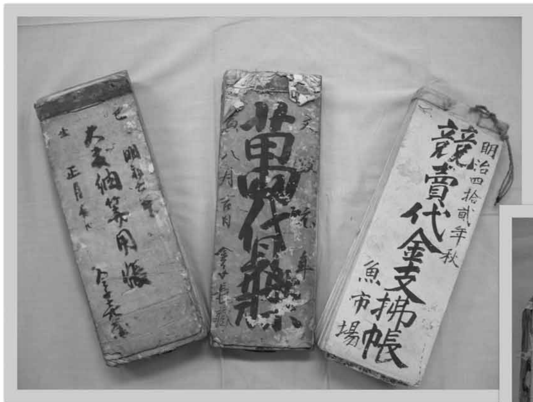
「金子芳彦家文書」の経営帳簿（「金子芳彦家文書」解題参照）