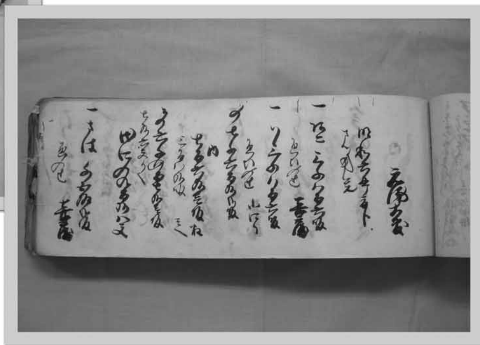
明和六（1769）年の夏に大敷網で1万匹近くの「あこ（トビウオ）」・「さば」が水揚げされたことを伝えている（明和六年「大敷網算用帳」目録番号2-1）