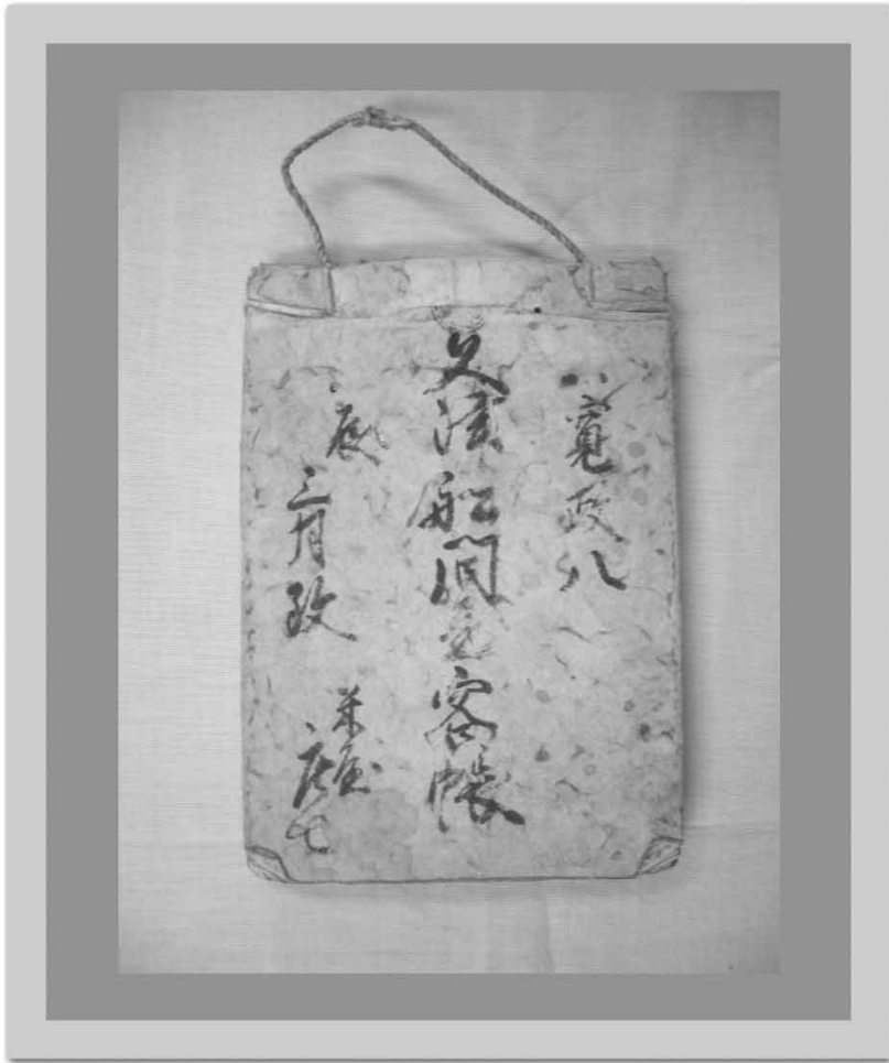
寛政八（1796）年三月「久津船問屋客帳」 （「奥藤博家文書」目録番号 1）