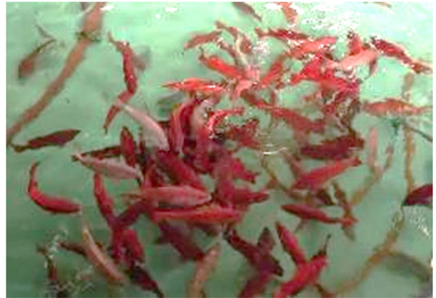
図2. 養殖試験の水槽で遊泳しているスジアラ