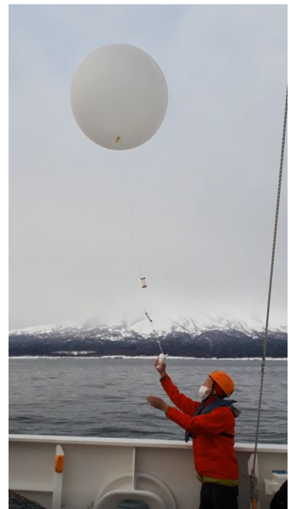
図 3 水産大学校練習船耕洋丸による洋上気球観測の様子。