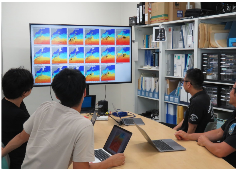
水温分布図を見ながらカツオの漁場形成について検討