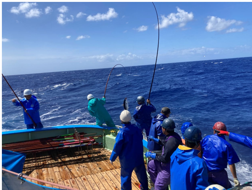
船でのカツオ釣獲調査