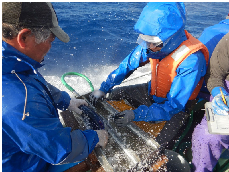
釣れたカツオに標識を装着する様子