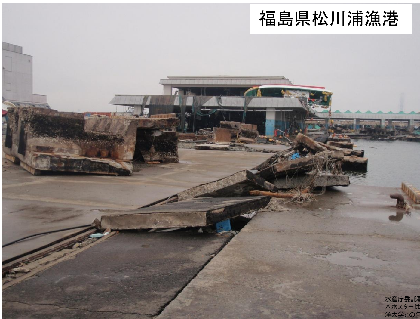
福島県松川浦漁港