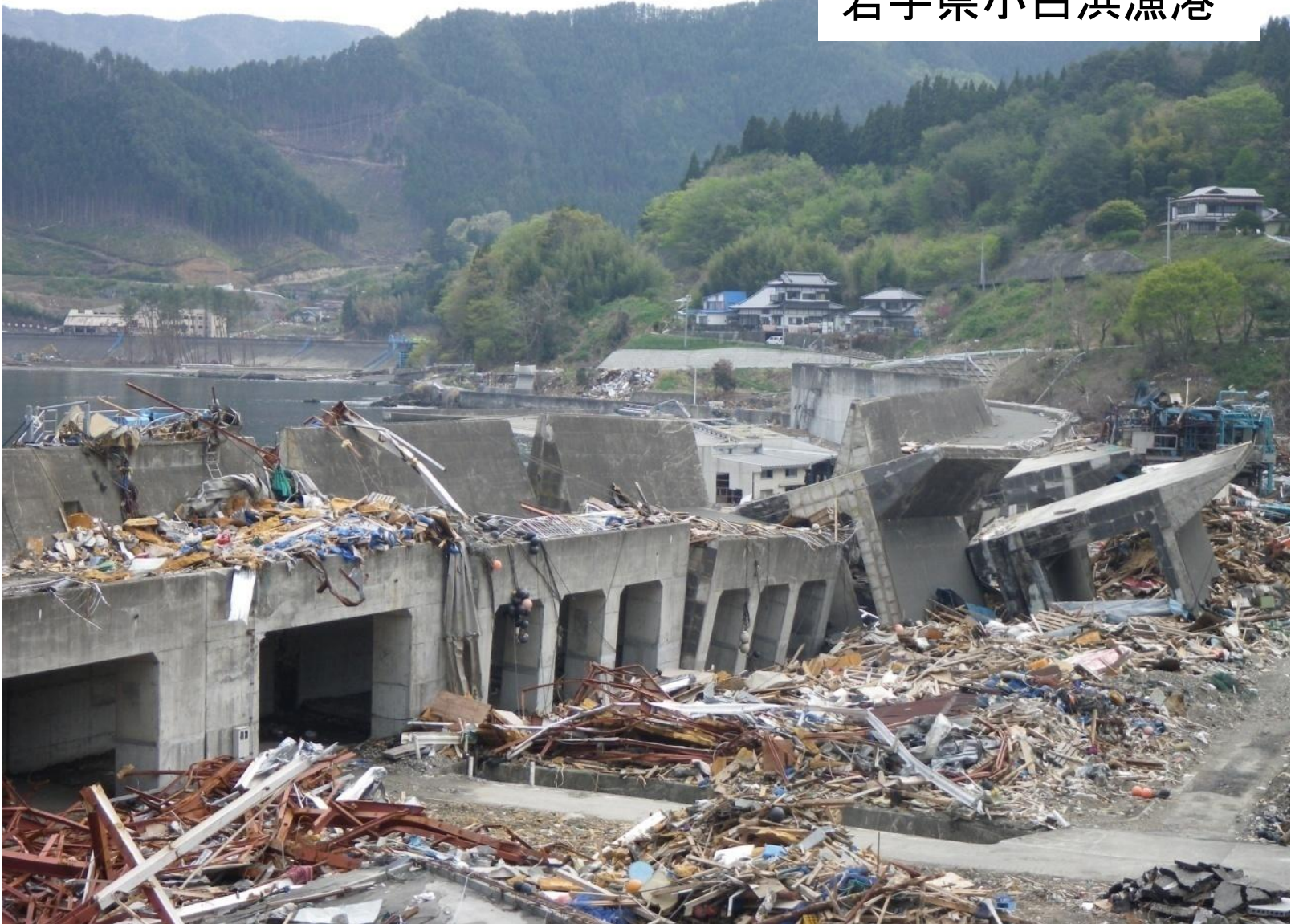
岩手県小白浜漁港