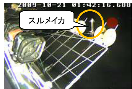
イカ釣り漁船とその周辺のソナー映像