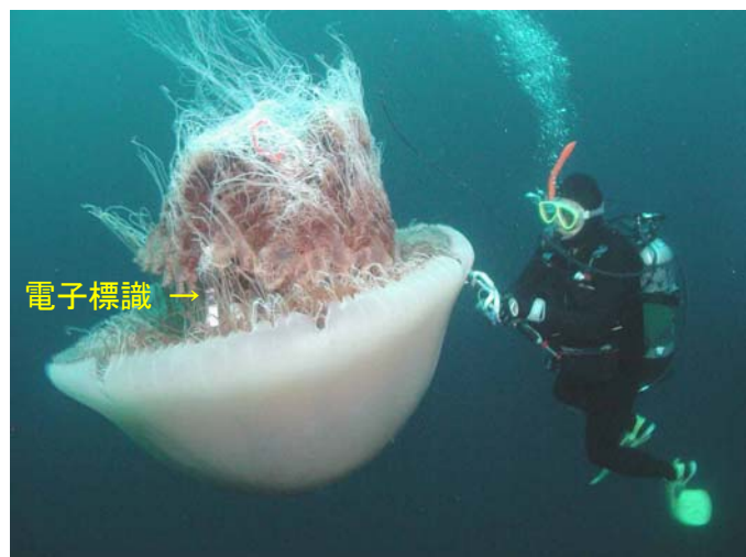
大型クラゲへの電子標識の装着