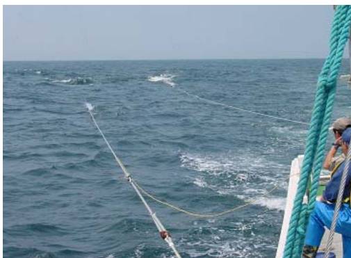
さより網のサイドトローイング曳網