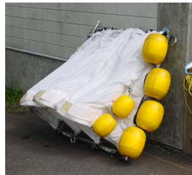
開発したキャンバス製カイト