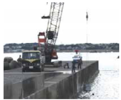
固化体ブロックの製作・設置