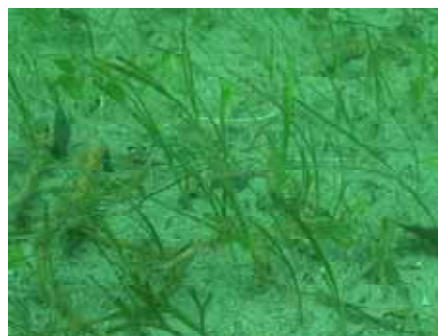
秋期まで残存したアマモ