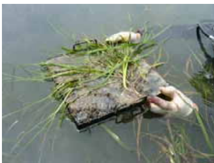
播種固化体でのアマモの成長