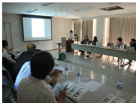
図2. 女子美術大学の学生さんによる作品の発表。いくつかは実際の展示に取り入れられる予定です。