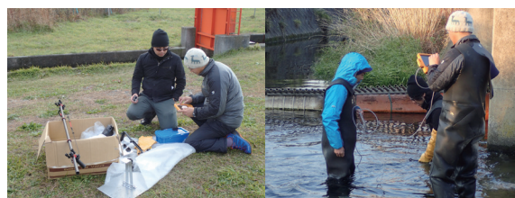
図3. 女子美術大学の講師によるサケのビデオ撮影。