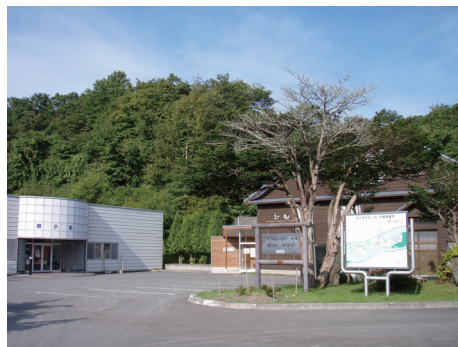
図1. 「さけます情報館」の外観。

平成 28 年 4 月ごろには、リニューアルされた展示施設を皆様に楽しんでいただける見込みです。名称は休憩場所や駐車場など一般公開しているエリア全体が「千歳さけますの森」、その中のリニューアルした展示施設は「さけます情報館」となります。マスコットキャラクター制作も予定しており、これらを活用して、さけます類のふ化放流をはじめ、北海道区水産研究所の業務や研究開発成果を広く知っていただけるようになればと期待しています。