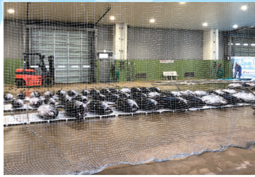
衛生管理が行われている荷さばき所 (産地卸売市場)