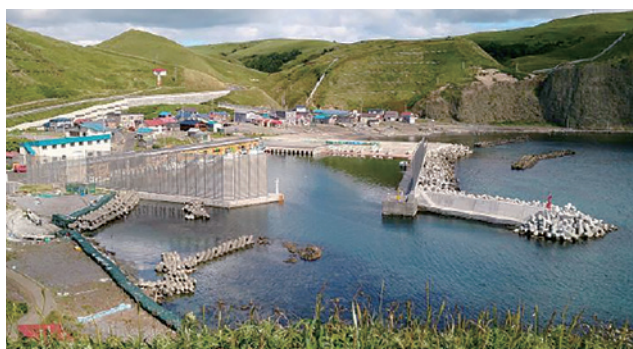
📷 1 地元漁船が利用する小規模な漁港 (防風フェンス付き)

日本を取り囲む海岸線は約35,000キロメートルです。そこには約2,800の漁港と約1,000の港湾があります。漁港と港湾は、それぞれ漁港漁場整備法、港湾法という法律にもとづいて整備され、維持・管理されています。漁港は漁船が利用する港、港湾は貨物船やタンカーなどが利用する港というイメージですが、人々や物資を輸送するフェリーやプレジャーボート、水産庁の漁業取締船、海上