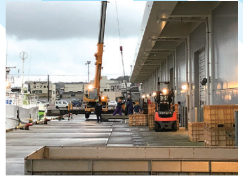
衛生管理が行われている漁港の陸揚げ岸壁