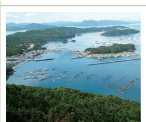
鹿児島県薄井漁港