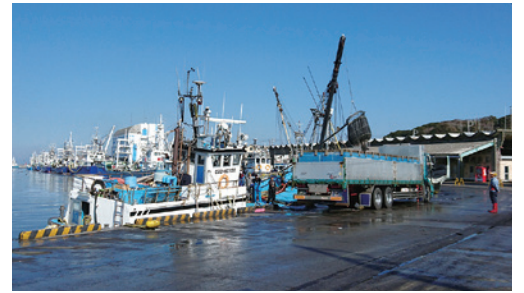
漁獲した魚を漁船から トラックに移しているようす