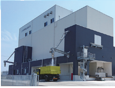
製氷施設で作られた氷を 運搬車に積み込むようす