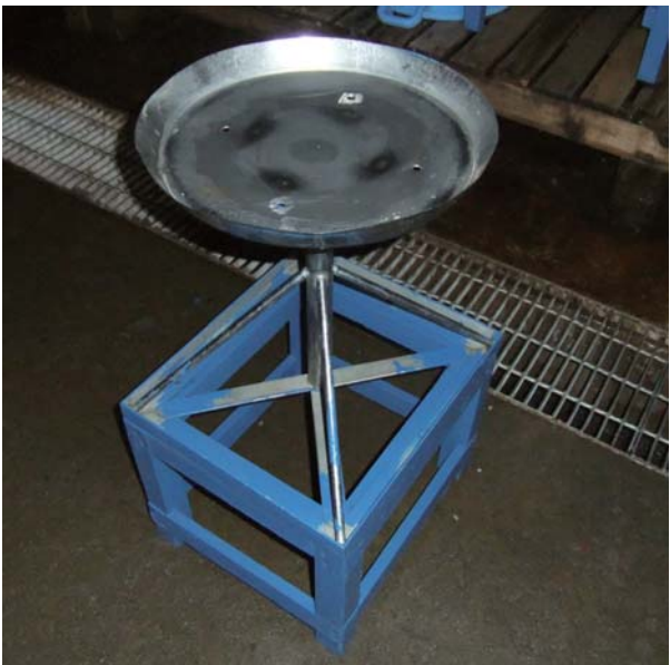
写真3. 攪拌台 受卵盆を三脚上部の天板に載せ、回しながら授精させる