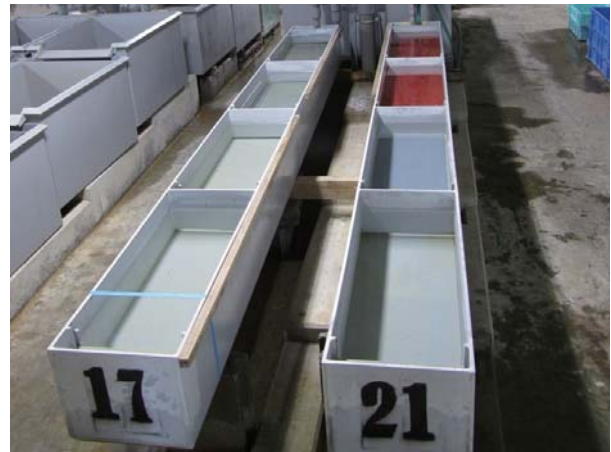
写真1. 増収型アトキンス式ふ化器 長さ3.5m、幅35cm、深さ30cmの塩化ビニール製一水槽当り40万粒の卵を入れることができる

1888年の千歳中央ふ化場の開設は、わが国のさけます類の人工ふ化放流技術の発展の原点であり、この地を中心とした数多くの試行錯誤の繰り返しを経て、わが国に適合した技術に発展していく。戦後間もない1951年に水産資源保護法が施行され、1952年に「北海道さけ・ますふ化場」が設置されてからは、北海道さけ・ますふ化場による様々な調査研究や技術開発により、現在の技術が形作られていくことになる。特に1960年代に入ってから、サケ稚魚の給餌飼育の導入（1962年）、増収型アトキンス式ふ化器（写真1）及びボックス型ふ化器の