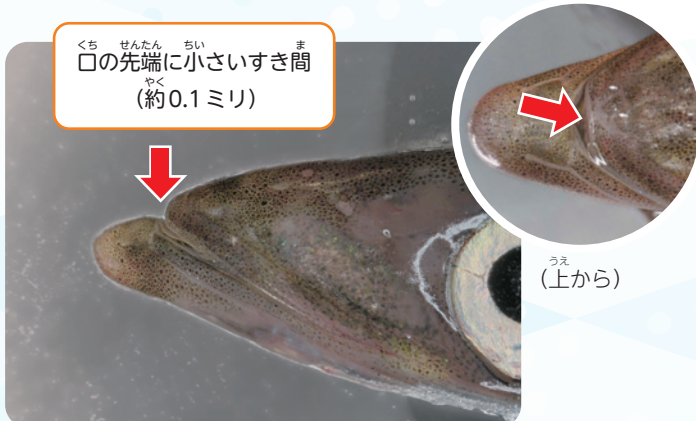
くち せんたん ちい ま 口の先端に小さいすき間 (約0.1ミリ)

イカナゴの口には0.1ミリほどの小さなすき間があり、砂の中でも海水だけを吸い込んで呼吸することができます。