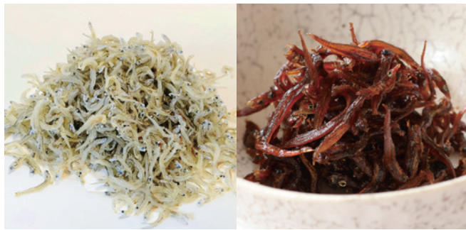
🐟2 イカナゴのカナギチリメン(左)と、くぎ煮(右)

しかし、最近、日本全国でイカナゴが減少しています。瀬戸内海東部では、1970年代には60,000トン以上とれていましたが、2022年には約2,500トンまで減少しました。温暖化で海水温が上がったり、エサのプランクトンが減ったり、たくさんの卵を