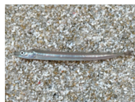
円筒形で細長いイカナゴ