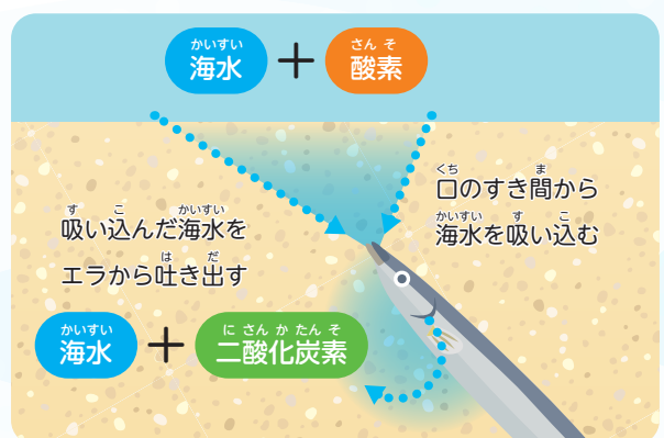
すな なか こきゅう 砂の中で呼吸するようす