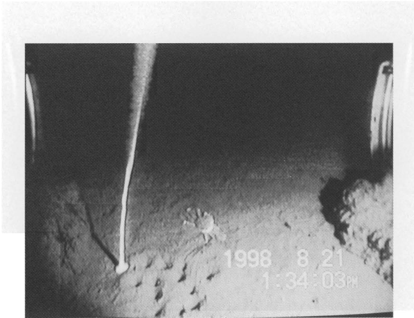
図2 曳航式深海用ビデオカメラで観察されたズワイガニ