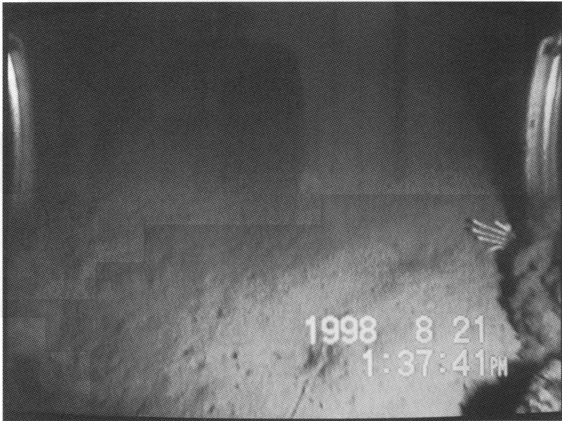
図4 ソリ部分に牽かれるズワイガニ